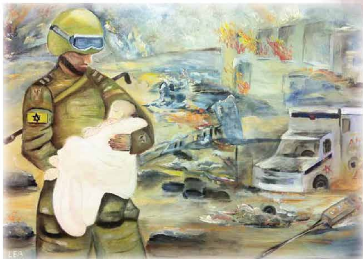
לאה טובול. "חייל מציל חיים"