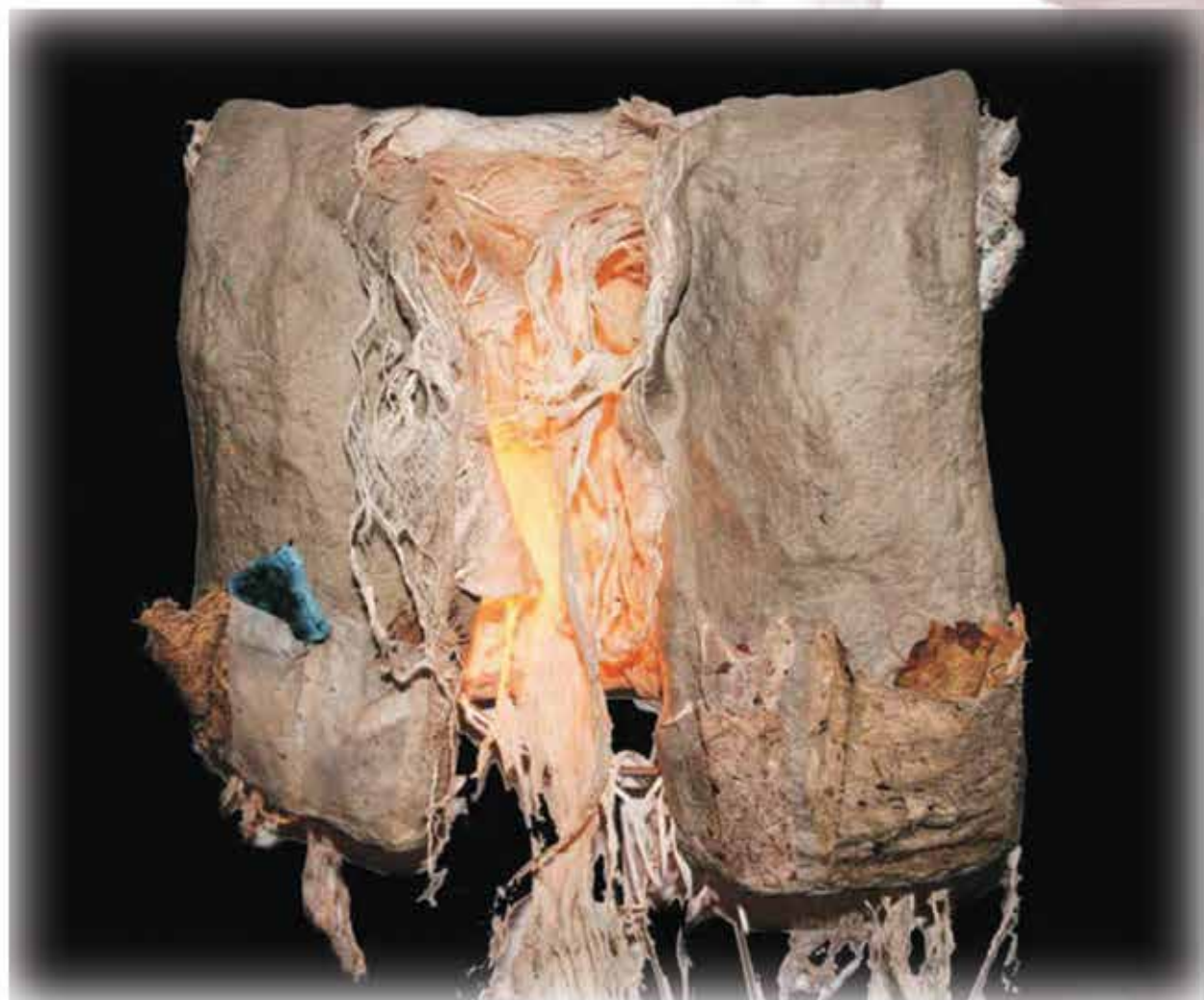
רחלי יוסף. "ביתי מבצרו"