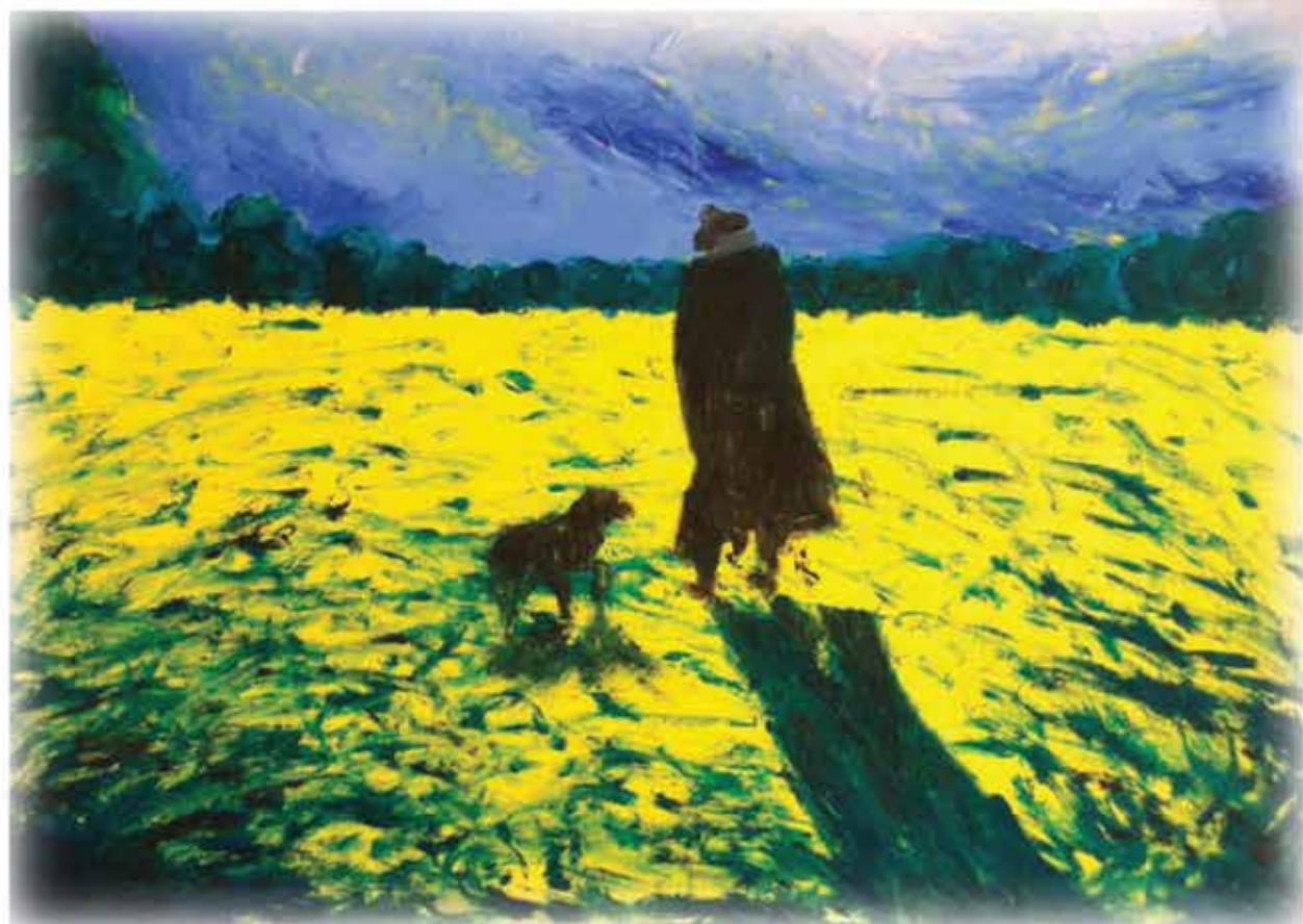
גדי אלקרמיה. "סופה"