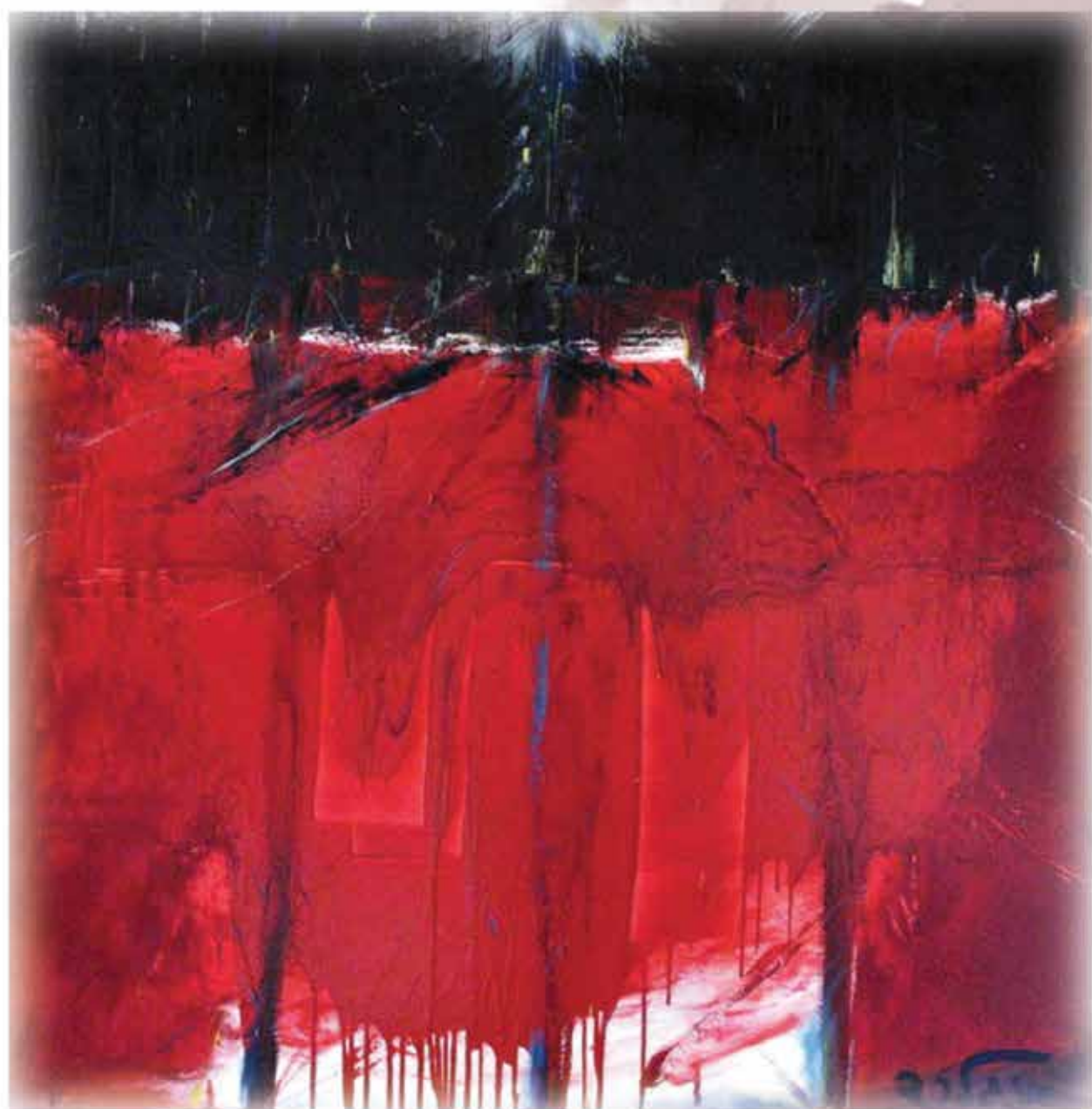
יהודית אנגלרד. "כאב"