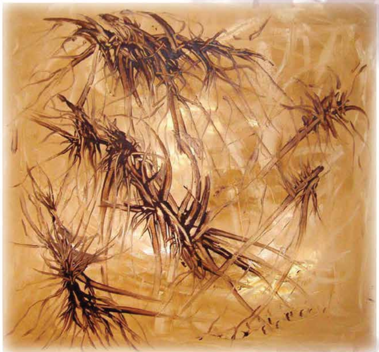
חנה ארדות. "ללא כותרת"