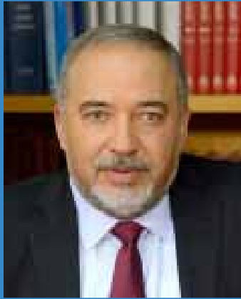
יקירי, בני המשפחות,

מלחמות ישראל והפעילות הביטחונית לאורך השנים הותירו חלל עמוק בלב אומה שלמה. חלל שלעולם לא נצליח למלא. השורות יישארו תמיד חסרות, החדר תמיד יהיה ריק, והלב תמיד יישא את משא הגעגועים.