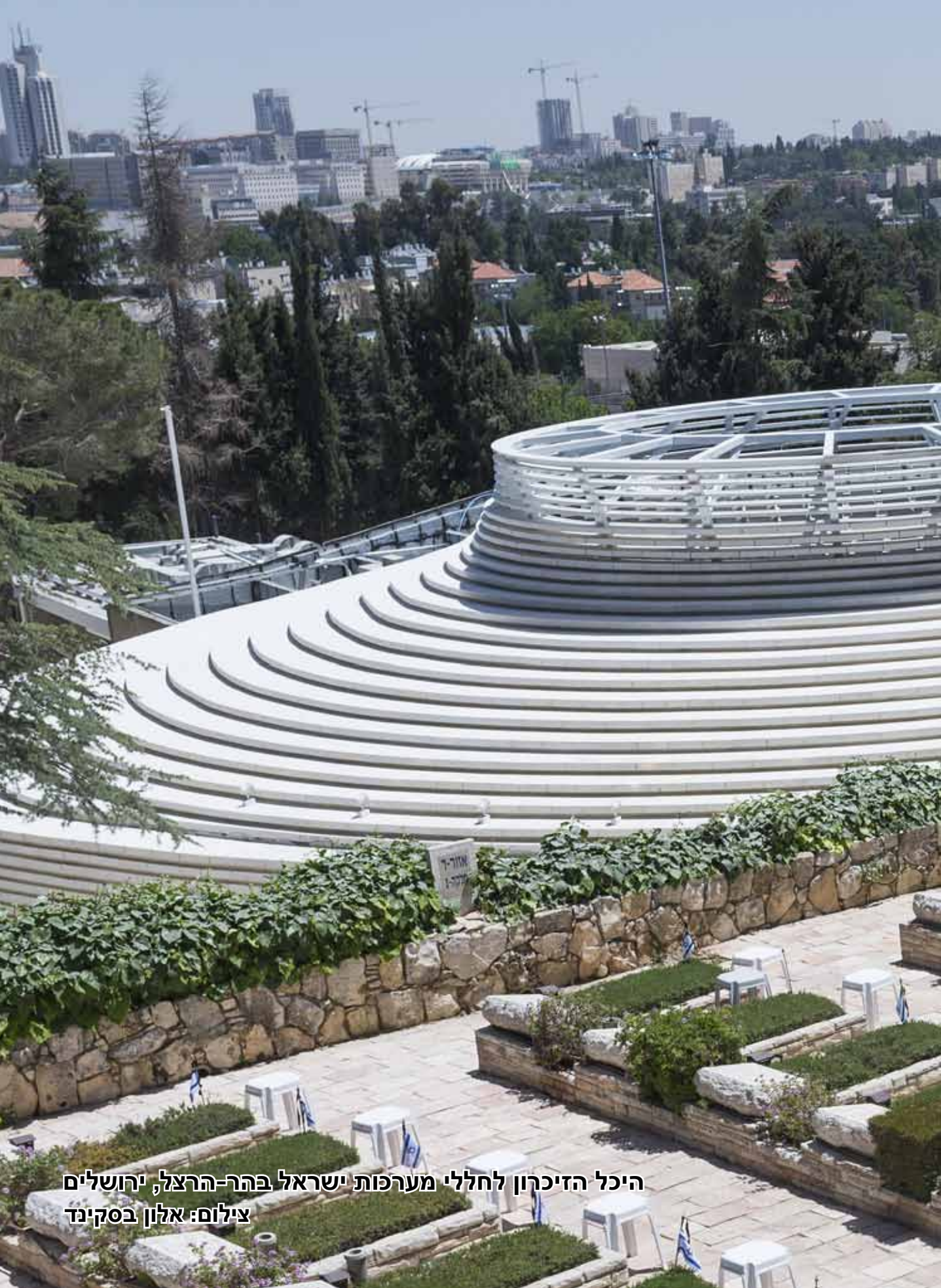
היכל הזיכרון לחללי מערכות ישראל בהר-הרצל, ירושלים