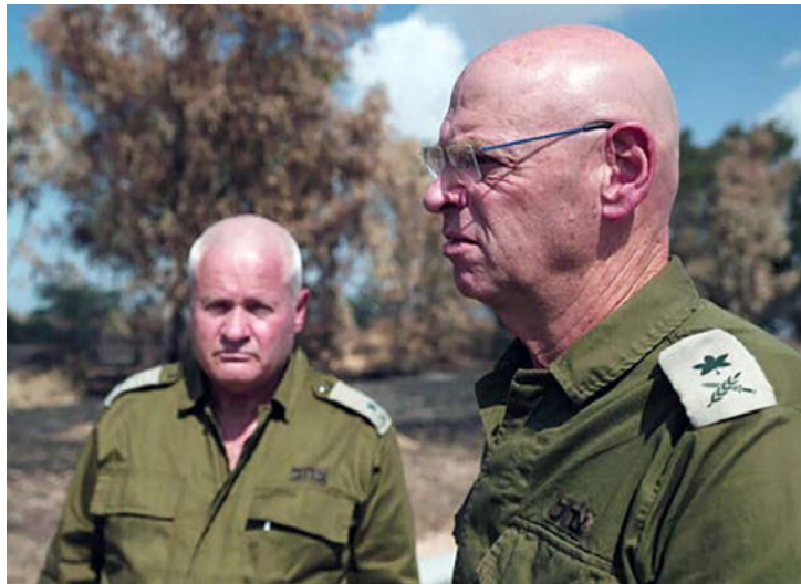
אלוף (במיל') נועם תיבון ואלוף (במיל') ישראל זיו בעוטף עזה

"אני בדילמה נוראית. אני קילומטר מנחל עוז. מצד שני, יש שם פצוע אנוש מדמם. אני מחליט לא להניח לו למות. ערכים ומנהיגות זה בלי דיבורים. זה