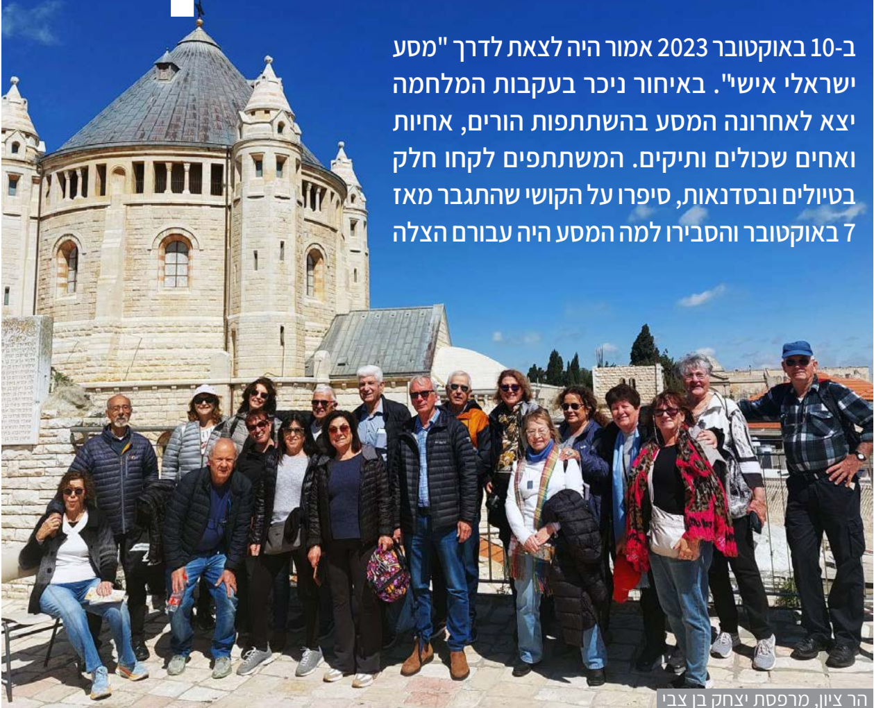
הר ציון, מרפסת יצחק בן צבי

ב-10 באוקטובר 2023 אמור היה לצאת לדרך "מסע ישראלי אישי". באיחור ניכר בעקבות המלחמה יצא לאחרונה המסע בהשתתפות הורים, אחיות ואחים שכולים ותיקים. המשתתפים לקחו חלק בטיולים ובסדנאות, סיפרו על הקושי שהתגבר מאז 7 באוקטובר והסבירו למה המסע היה עבורם הצלה