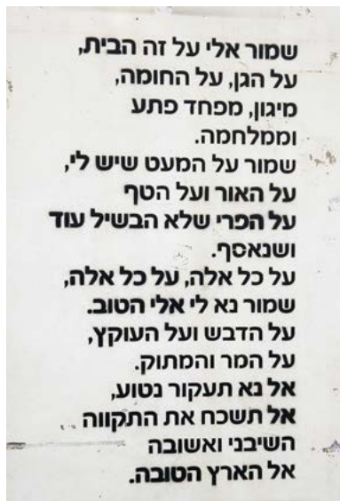
הכתובת על המיגונית בכניסה לשניר