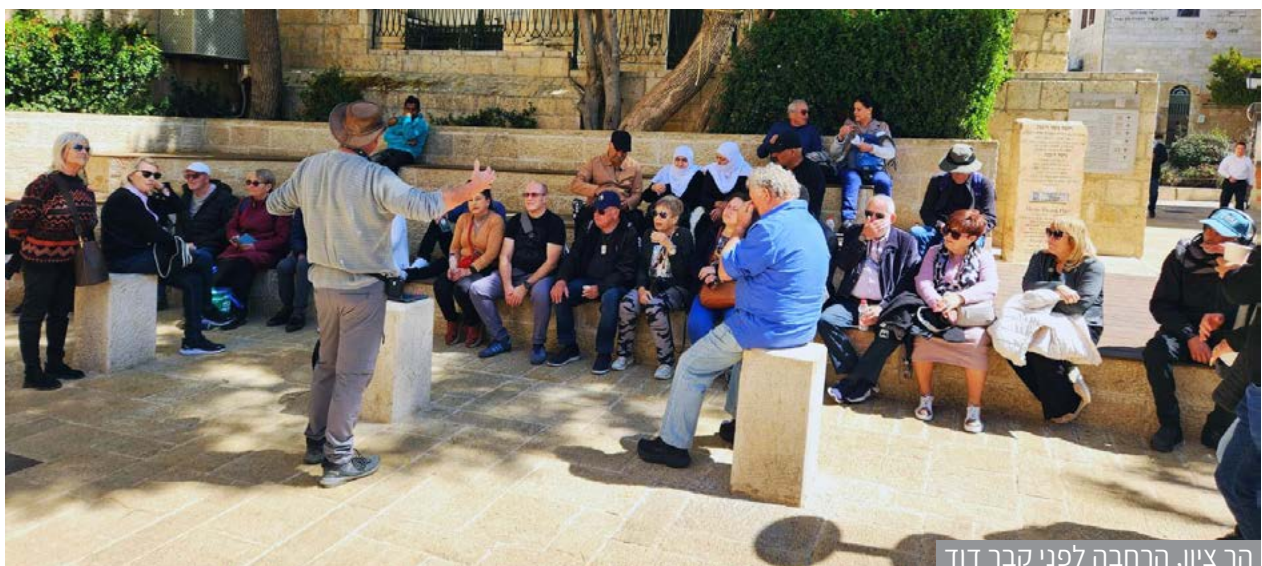
הר ציון, הרחבה לפני קבר דוד